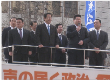
辛島公園での街頭演説