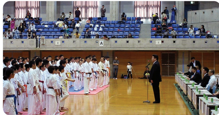
全九州空手道親善大会で挨拶