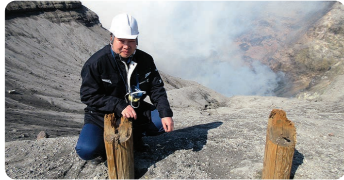
立入規制の阿蘇山火口を調査