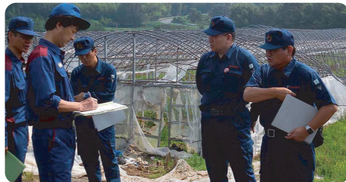
農林水産委員会で被災地を視察(宇城市)

農林水産常任委員会で先の台風3号、その後の豪雨被害の調査で県下の被害状況を視察し、早急な復旧策を委員会で要望いたしました。