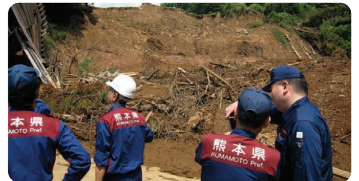
農林水産委員会で被災地を視察(小国町)