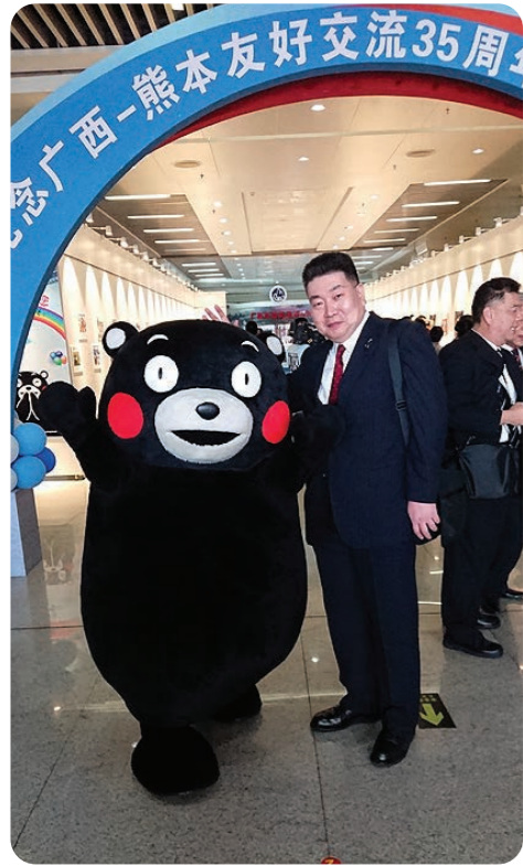
広西企画館【熊本パネル展】 オープニングセレモニーでくまモンと

7月9日～12日 熊本・広西友好提携35周年で記念行事等に参加、熊本地震への見舞金への御礼と「くまモン」とのトップセールスに同行いたしました。