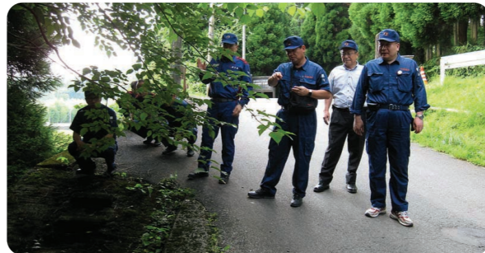
農林水産委員会で被災地を視察(南小国町)