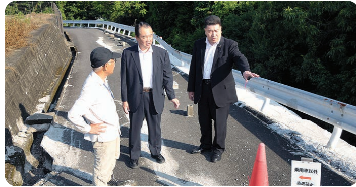
南区城南町の大規模宅地被害を調査