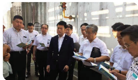
霧島酒造リサイクルプラントを視察