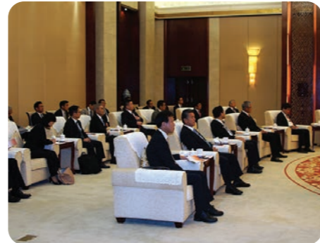
広西壮族自治区を表敬訪問