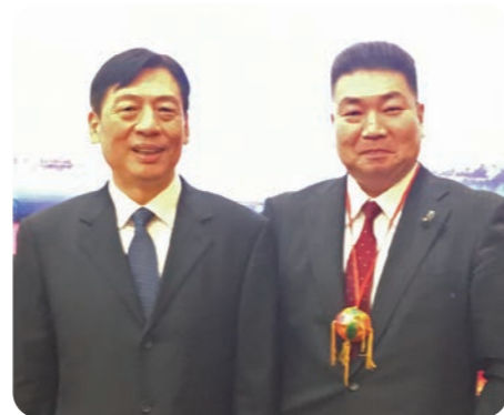
歓迎レセプションで広西壮族自治区党 委員会 孫大偉(そん・だいい) 副書記と