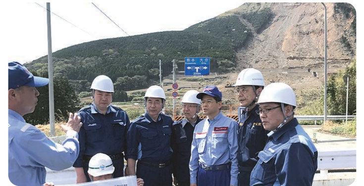
石井大臣と阿蘇大橋崩落現場を視察