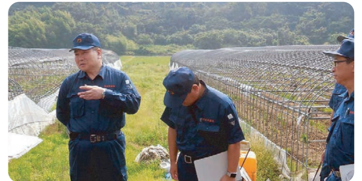
農林水産委員会で被災地を視察(宇城市)