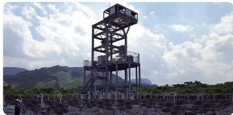
宮崎大学ビームダウン式太陽光装置を視察

九州・沖縄再生可能エネルギー研究会にて最新技術を視察。“九州の再生可能エネルギーのポテンシャルは全国の25%を占め、九州が「再エネアイランド」として果たす将来性は非常に重要です。太陽光、水素、水力、地熱、風力、バイオマス等、九州の地の利を生かした取り組みを研究し、議会質問や政策に役立てます。