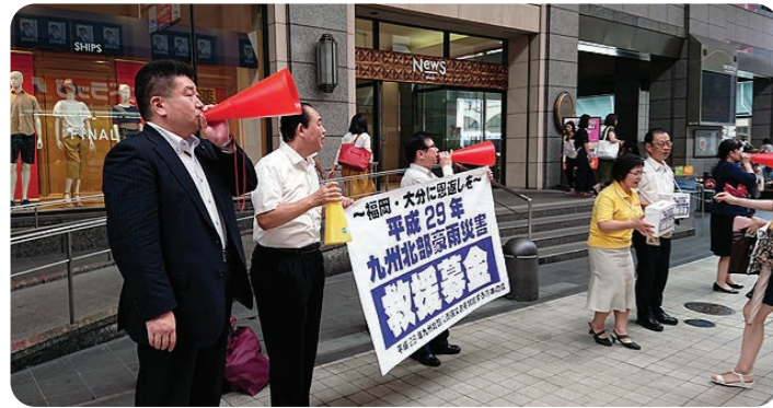
北部九州豪雨災害救援募金に応援参加