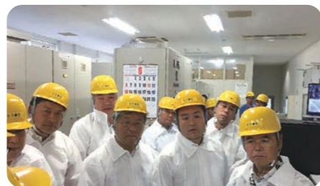
南国殖産(株) 鶏糞発電設備を視察