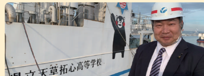
実習船【熊本丸】の建造現場を視察