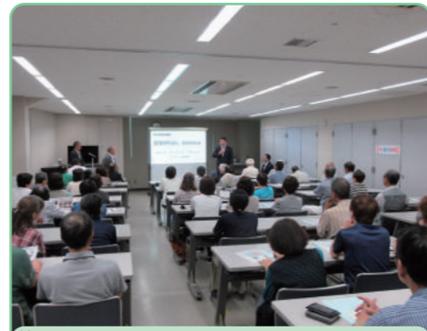
飽田・天明地区 9月