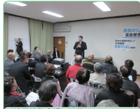
田崎団地集会場 11月