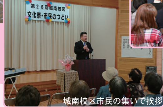
城南校区市民の集いで挨拶