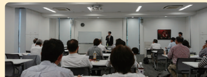
公会計制度改革の効果を検証