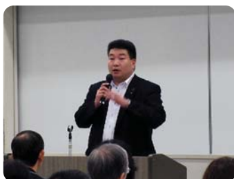
●各地で県政報告会