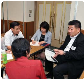
●ワークショップで 「今後の地域社会」を議論