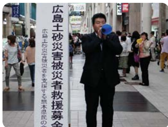
●広島土砂災害被災者 救援募金に参加

県議会の報告会や、国と県と市町村の置かれた課題や現状を分析し、SNS等も活用し広く県民の皆様へ報告いたします。