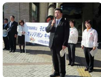
●オレンジリボンキャンペーンで 街頭演説