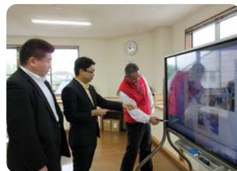
●在宅就労支援事業への 現場視察・意見聴取