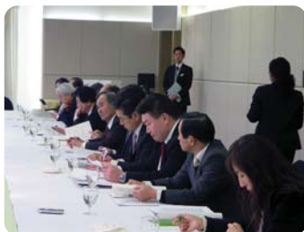
●韓国・ソウルにて 南九州3県観光誘致会議で現地旅行社と