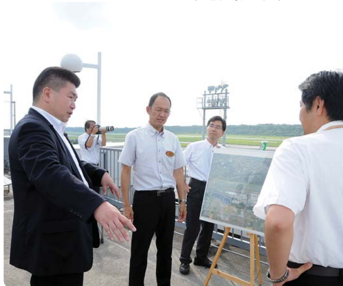
●阿蘇くまもと空港で担当者から意見聴取