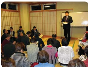
●各地で県政報告会