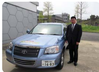
●究極のエコカー・FCV車に試乗