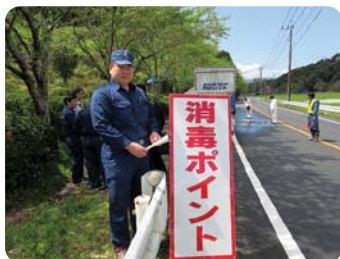
●鳥インフルエンザで 現地消毒地を視察