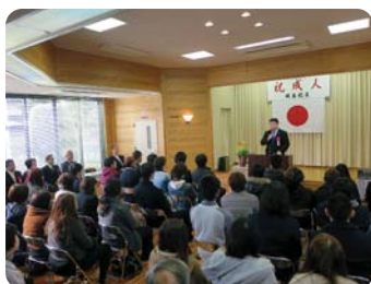
●地元城南校区成人の集いにて 新成人を激励