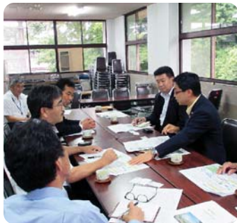
●阿蘇中央病院にて 要望・意見聴取活動

各地域・現場での意見聴取を実施し、県政の課題や方向性について、先進事例や研究成果等を視察・調査し議会活動の原動力とします。