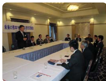
●若手・次期経営者との集いにて 意見交換