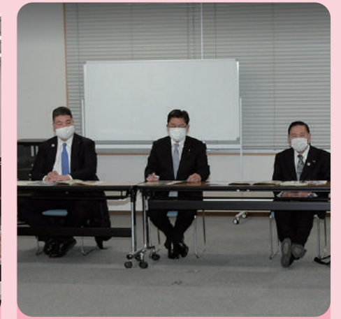
島原・天草・長島(3県架橋)勉強会