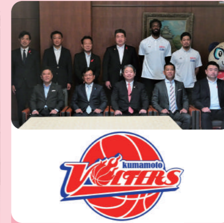
熊本ヴォルターズの表敬を受けB1昇格へ激励