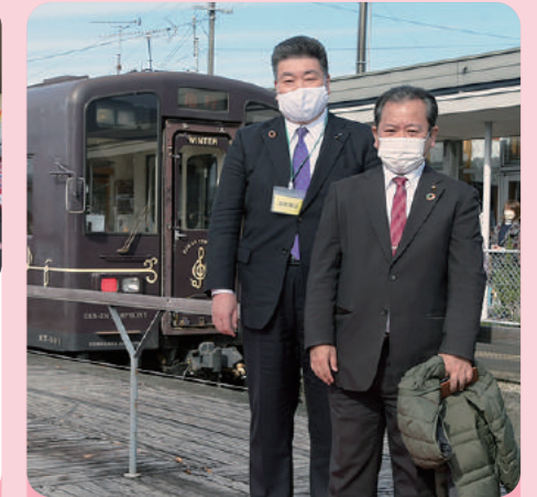
くま川鉄道部分開通を祝福(豊永人吉市議と同席)