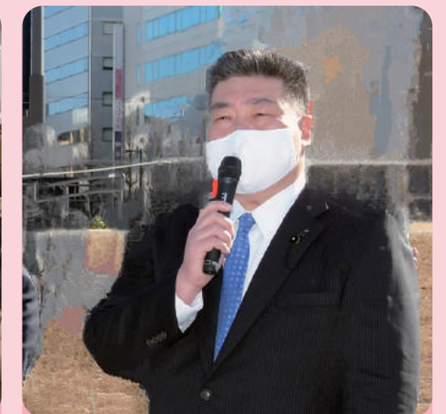
元氣と勇氣を各地で街頭演説