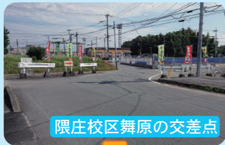
隈庄校区舞原の交差点