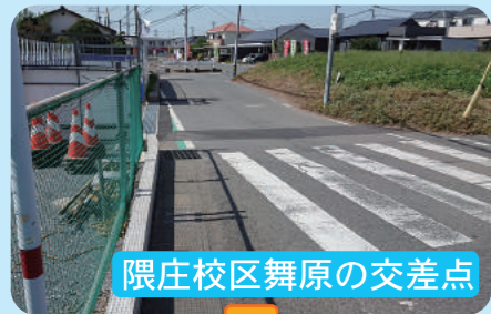
隈庄校区舞原の交差点