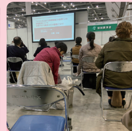
運動療法の現状と地域における健康づくりを学ぶ