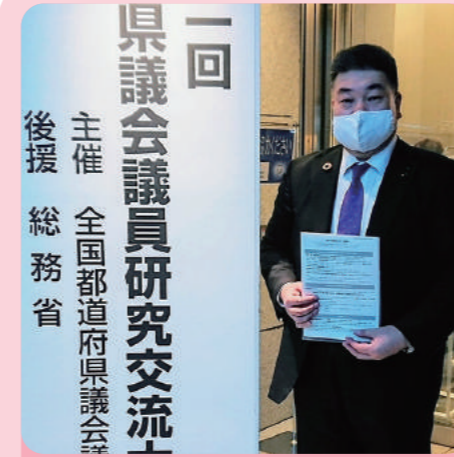
都道府県議会議員研究交流会へ参加 (JA共済ビル、都市センターホテルにて)

コロナ禍の中、ウィズコロナを見据え医療体制の有るべき姿、経済振興策等可能な限り視察研究や意見聴取、現場調査を実施いたします！！