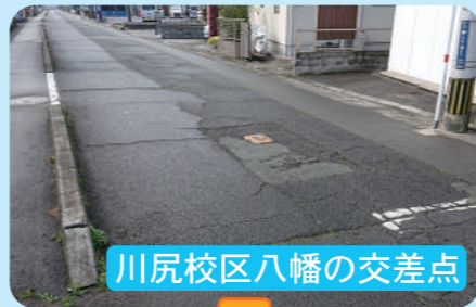
川尻校区八幡の交差点