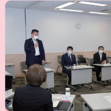
不登校の子供たちを支援する団体と意見交換